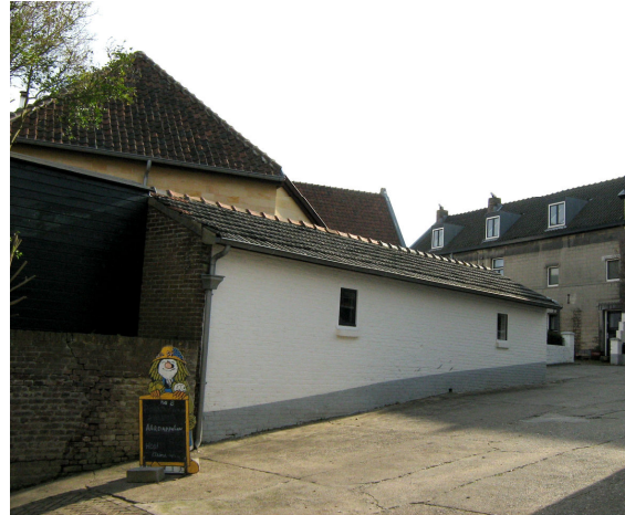
De opgang naar de boerderij Mares anno 2008.