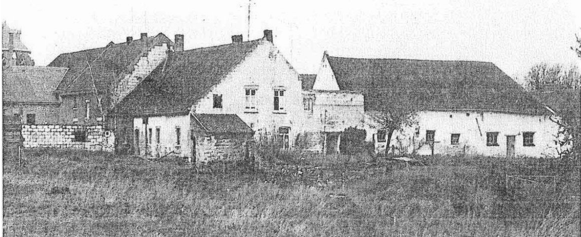
De boerderij aan de Pletzersstraat 10, die meer dan 300 jaar in eigendom van de familie Mares is geweest. De boerderij is een rijksmonument.