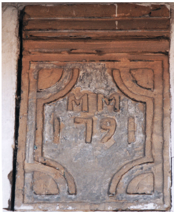
De gevelsteen uit 1791 met de initialen M M.