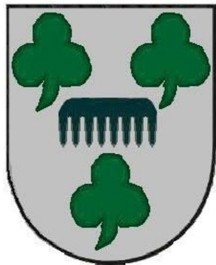
Wapens Marres en Mares.